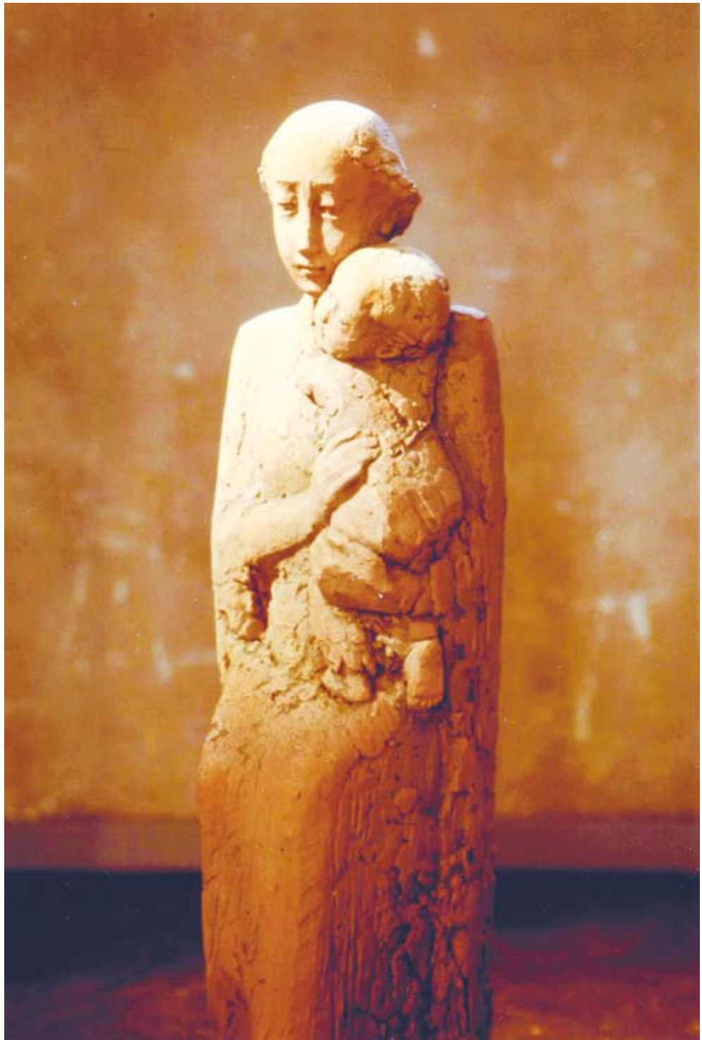
ÖMHETENS MADONNA (terrakotta)

Ordförande för Skulptörförbundet under åren 1999 - 2003.