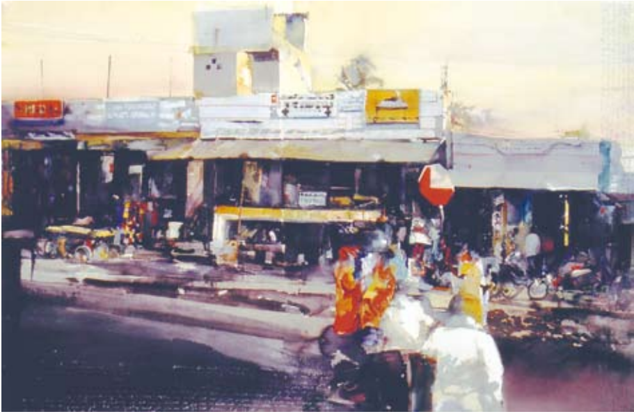
INDISKT INTRYCK (akvarell 2006)