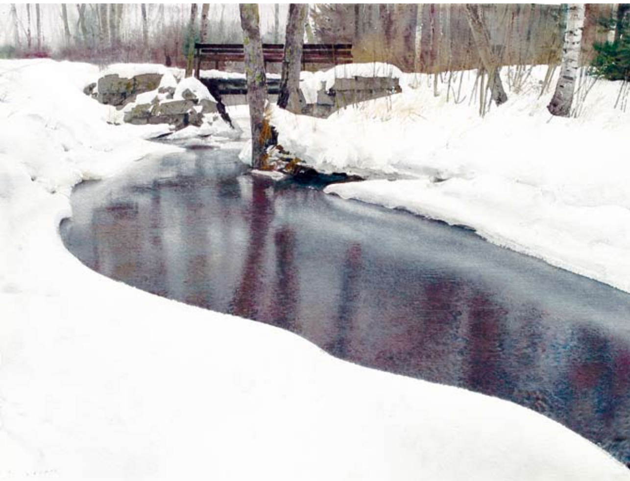
VÄRMLAND (56 x 76 cm)