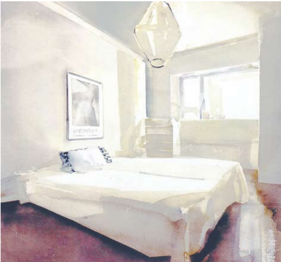
VITT RUM 1 (akvarell 2006)