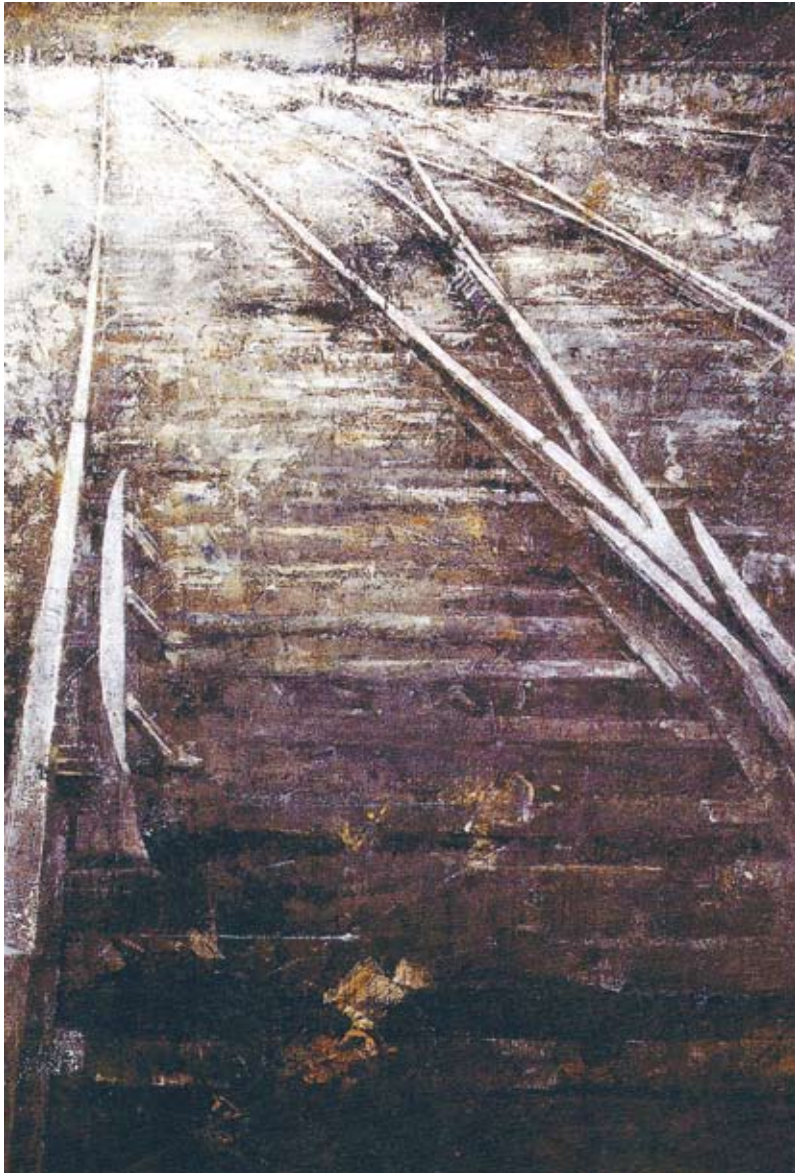
MOT DET OKÄNDA N.N. (olja)

Checkpoint Charlie är det symboliska namnet på projektet som utmanar ett 20-tal konstnärer att arbeta med begreppet ”gränser och kontroller”