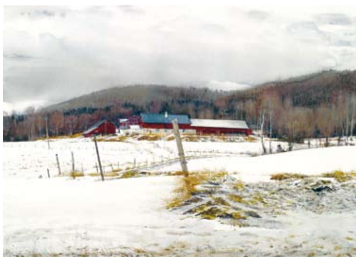
GÅRD (76 x 105 cm)