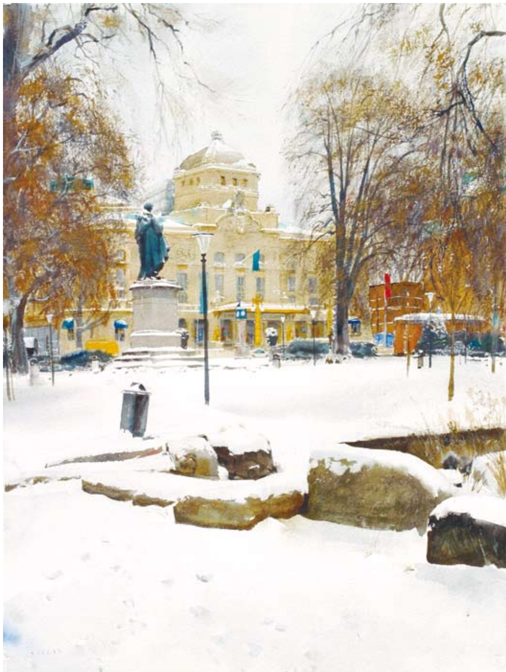
DRAMATEN (56 x 76 cm)

Alla hans målningar har en gemensam nämnare, nämligen att de alla på något sätt handlar om ljuset.