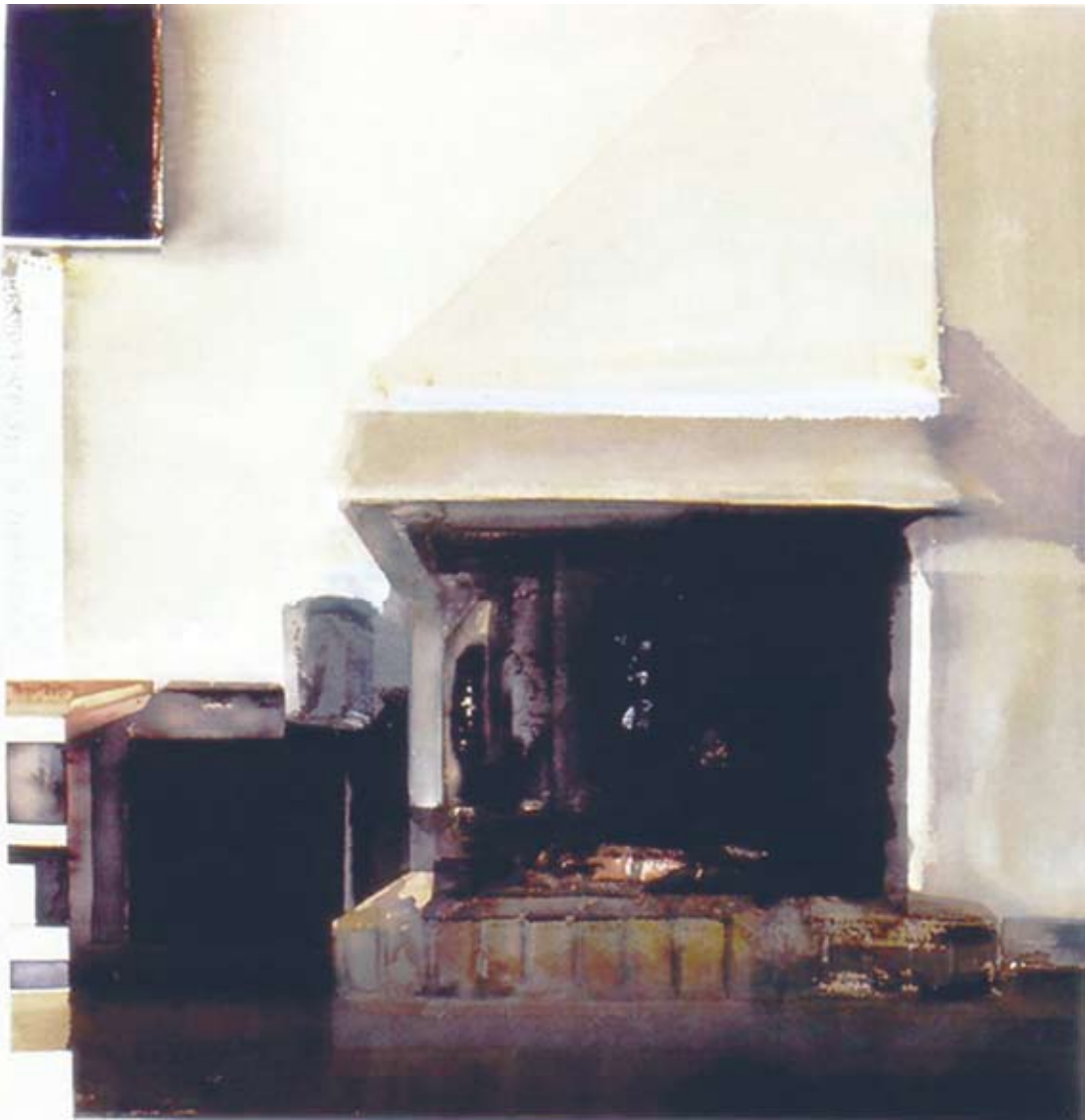
VITT RUM 2 (akvarell 2006)

Han är även författare och hans första bok skrev han 1983 och har sedan dess gett ut en lång rad böcker med egna texter och bilder på det egna förlaget Syntryck.