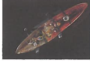
Journey. Finns på en konstskola i Turkiet.

Var huvudperson i filmen "Glasmästaren" som visades i SVT i juli.