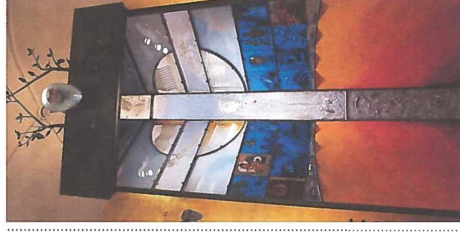
Altarskåpet i Växjö domkyrka